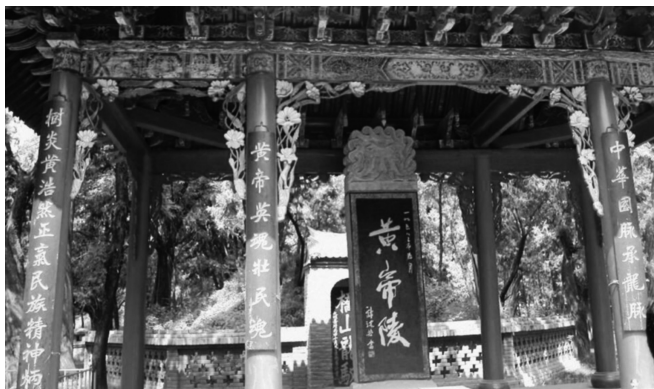
Mausoleo en la provincia de Shaanxi del Emperador Amarillo.

de embarazo, dio a luz a un hijo que hablaba desde el nacimiento. En otras versiones, Huang Ti se formó a partir de la fusión de las energías que marcaron el inicio del mundo. Vivió en un maravilloso palacio al oeste de las montañas Kunlun, con un guardián celestial en la puerta con cabeza humana, cuerpo de tigre y nueve colas. Las montañas Kunlun estaban llenas de pájaros y animales raros y de exóticas flores y plantas, y Huang Ti iba siempre acompañado de una extraña mascota: un pájaro que le ayudaba a cuidar su ropa y efectos personales. También se cuenta que poseía un tambor hecho con piel de kui, un ser mitológico que puede producir lluvia, viento o sequía.