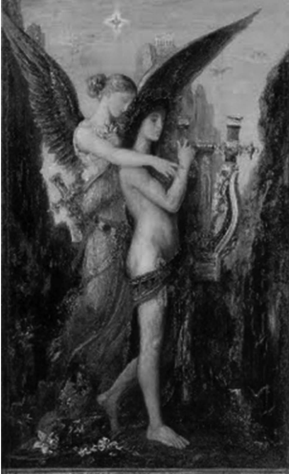
Hesiodo y la Musa , de Gustave Moreau. El poeta Hesíodo nos legó una obra en la que las tradiciones mitológicas son interpretadas en un sentido pragmático que permite comprender fábulas como la maldición de Prometeo en clave social y utópica.